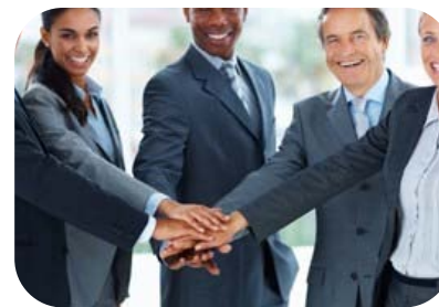
Participación en la Propiedad (PFT)