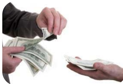
Participación en los Beneficios