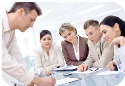
Participación en la Gestión